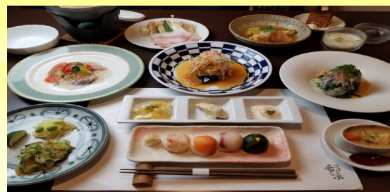
《希味のランチ一例》季節に合わせた料理です

旅行代金/お1人様 地域クーポン 3000円付 17,500円 → 11,500円