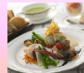
おしゃれフレンチプレート

旅行代金/お1人様 地域クーポン 3000円付 17,200円 → 11,200円