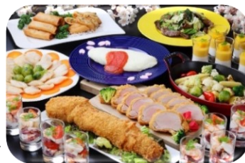
春の彩りバイキング

各地 ~ 平城京史跡公園(散策)~奈良(昼食)~ 大神神社(参拝)~ 長谷寺(拝観)~ 関ドライブイン(買物)~ 各地(18:30頃)