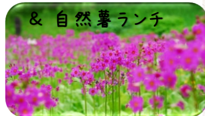
クリンソウ約15万本咲き乱れる!