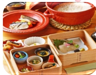
※サラダ・デザート・ドリンク (ハーフバイキング)

各地 ~ 平野神社(参拝)~京都(昼食)~ 知恩院・円山公園(散策)~ 京つけもの大安(買物)~ 各地(18:30頃)