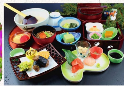
犬得だって、食事に手抜きなし

とろろめし 山のお造り 自然薯そば (冬期茶碗蒸) 香の物 小鉢三種 ところろ揚げ